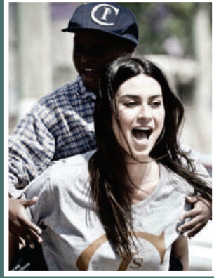
Eu tenho Voz - IPAM - São Paulo / SP