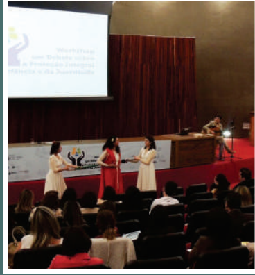
Projeto Sa e Vida - Escola - Eu Sou Apreensivo - RJ Rio de Janeiro / RJ